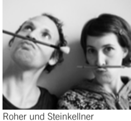
Roher und Steinkellner

11.10 Uhr, Kleiner Saal LESUNG 3./4. Schulstufe