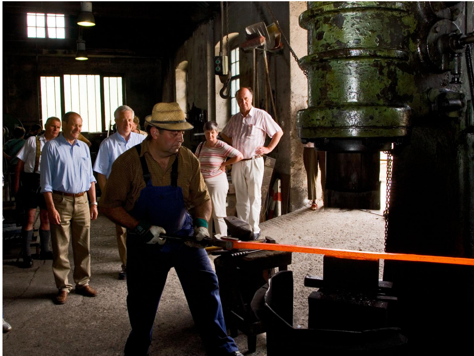
Werkzeugschmieden in den Hammerwerken