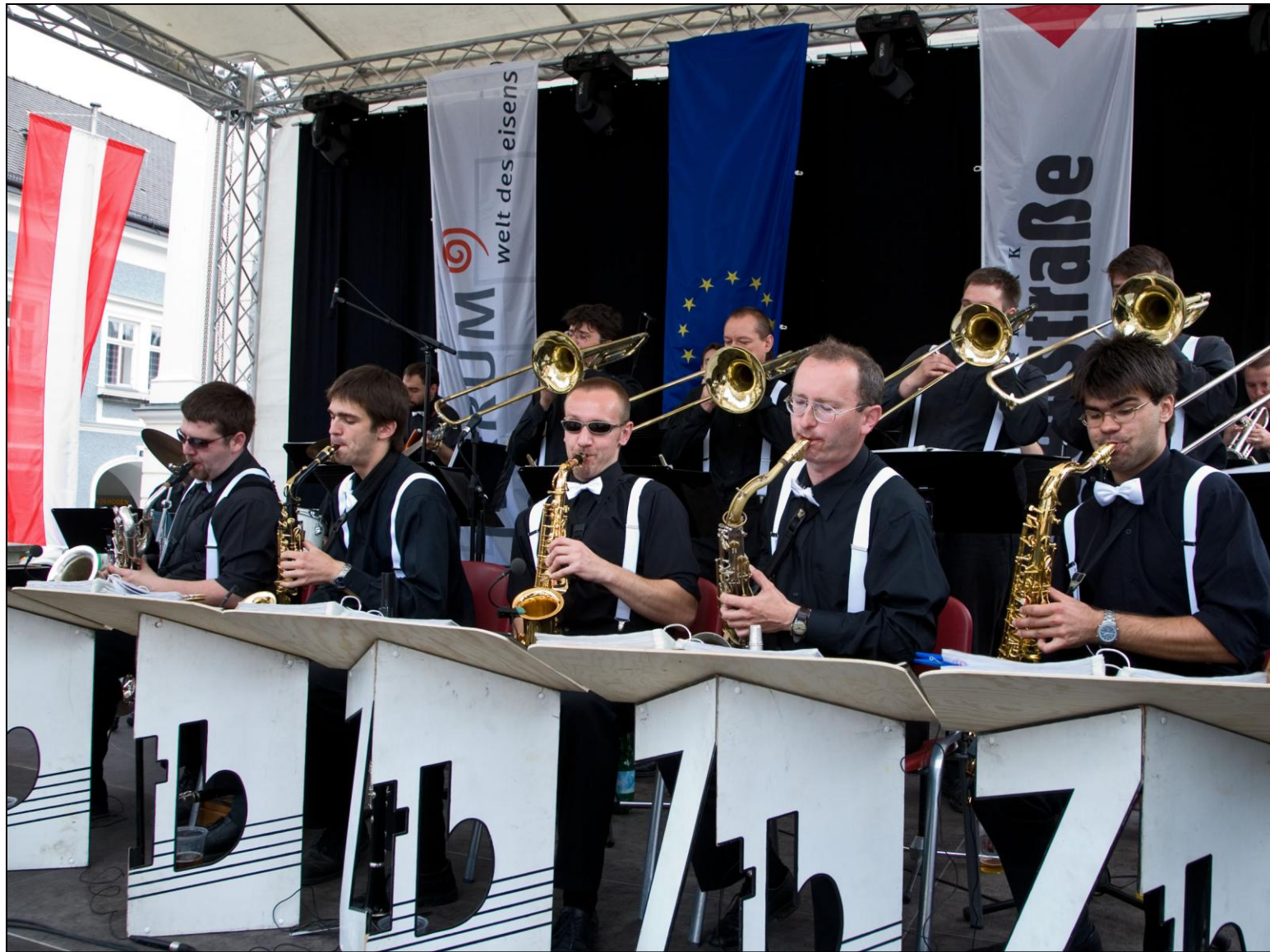
Musik und Tanzdarbietungen aus der Region Eisenstraße ....