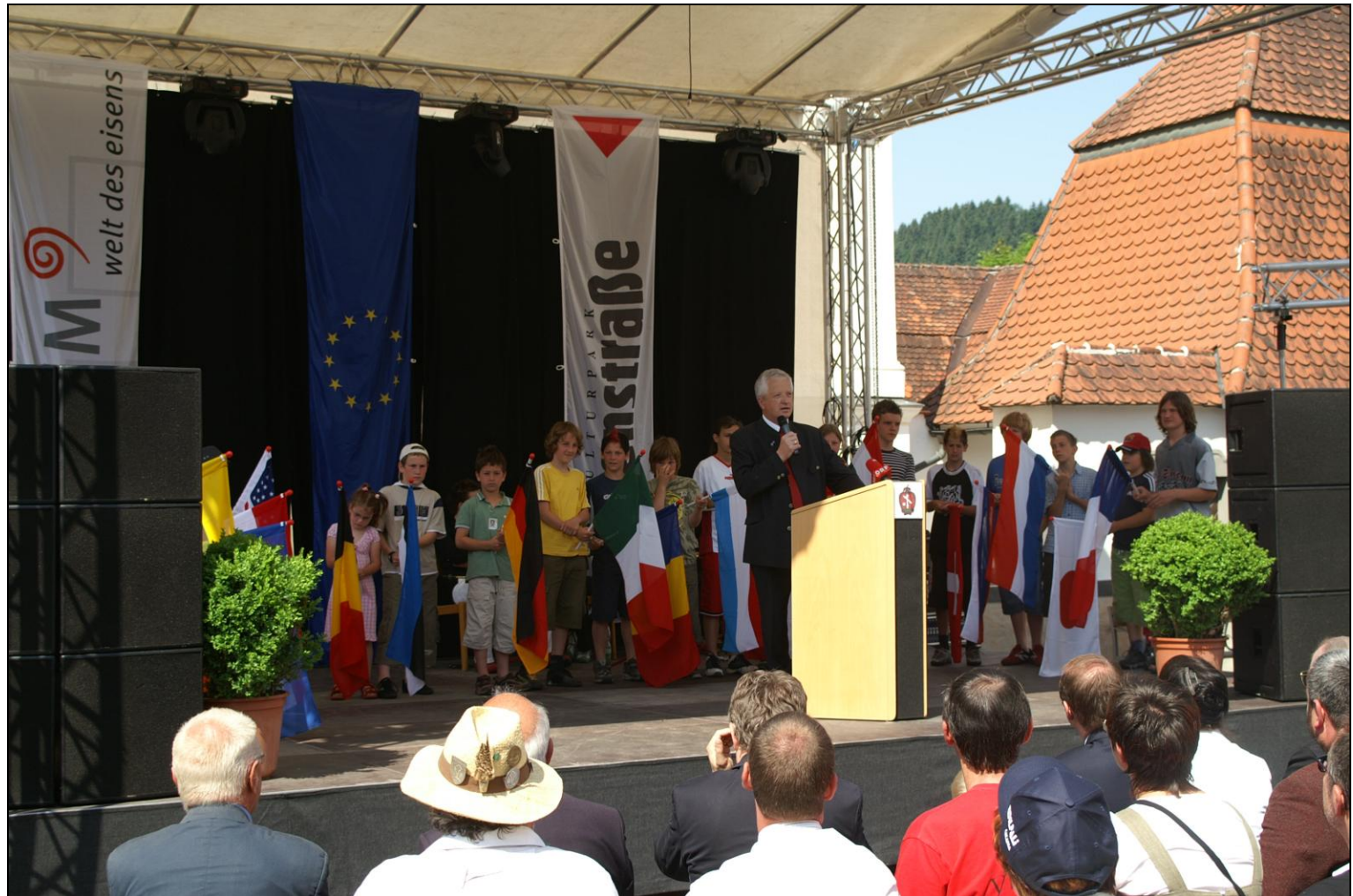
Eröffnung des Festes und Empfang