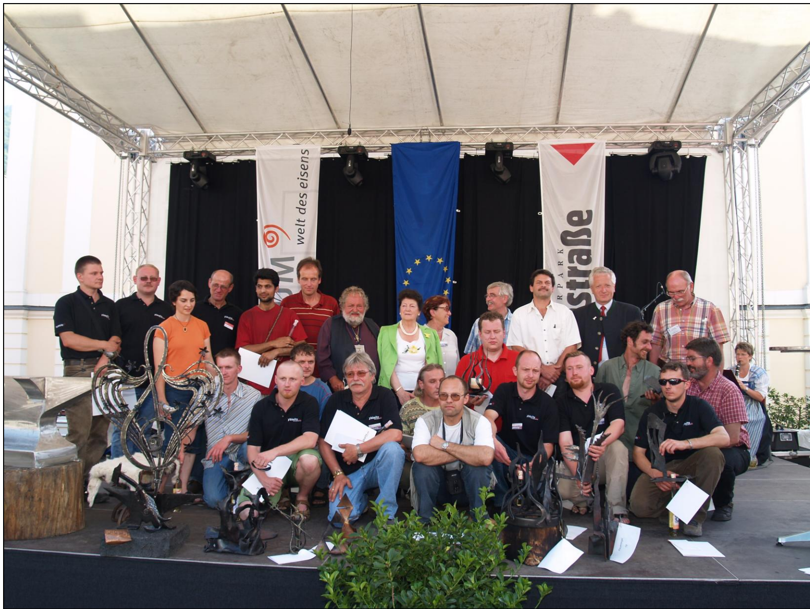
Prämierung der besten Schmiedearbeiten und Verabschiedung der Gäste und Feierlicher Abschluss.