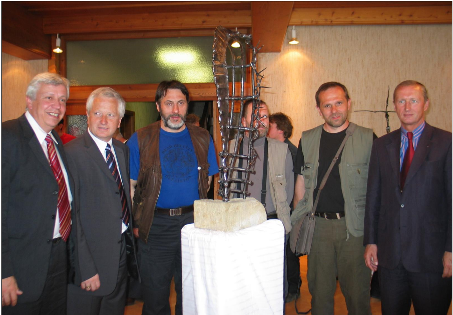
Ausstellung von Schmiedearbeiten mit hoher Qualität aus europ. Ländern (z.B. 2004 Tschechien, 2006 Sizilien, 2008 Litauen)