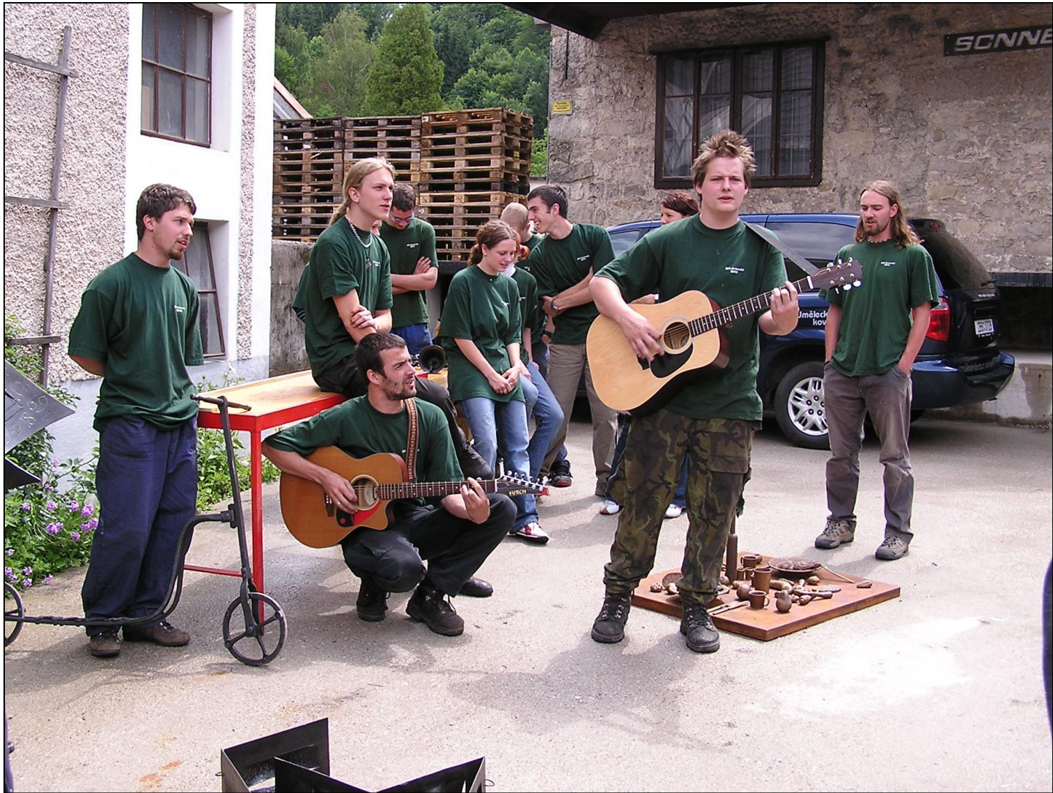
Präsentation von Schmiedeworkshops .....