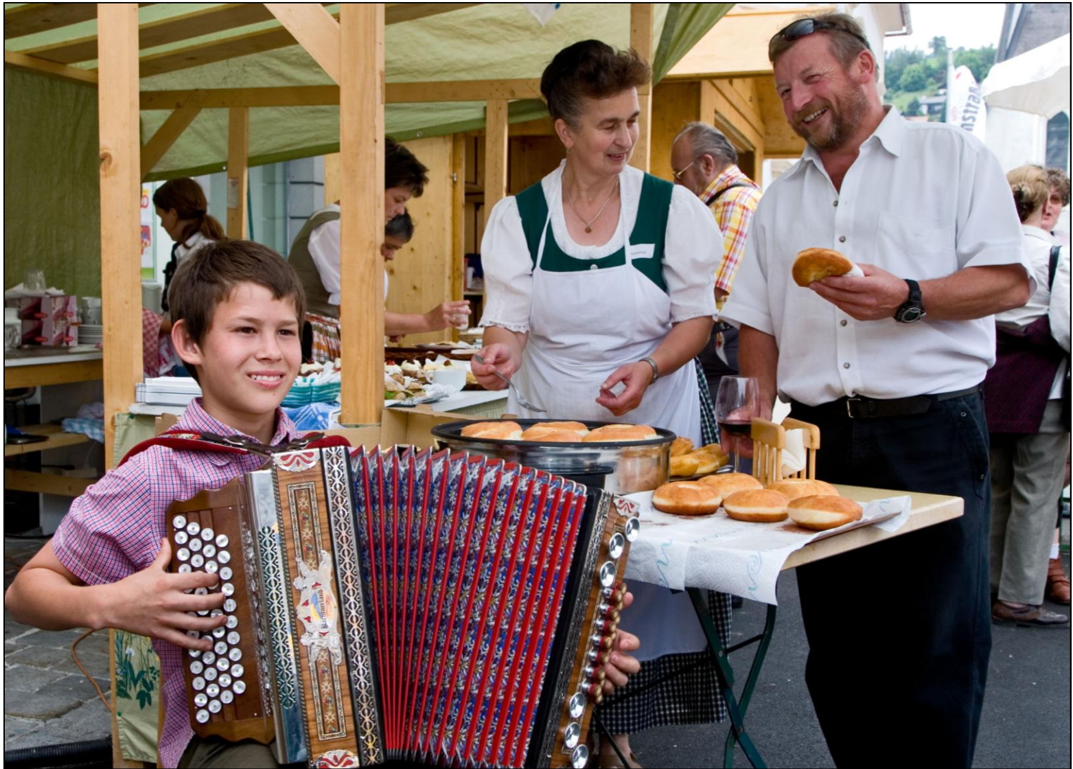
Kulinarisch Bodenständiges ....