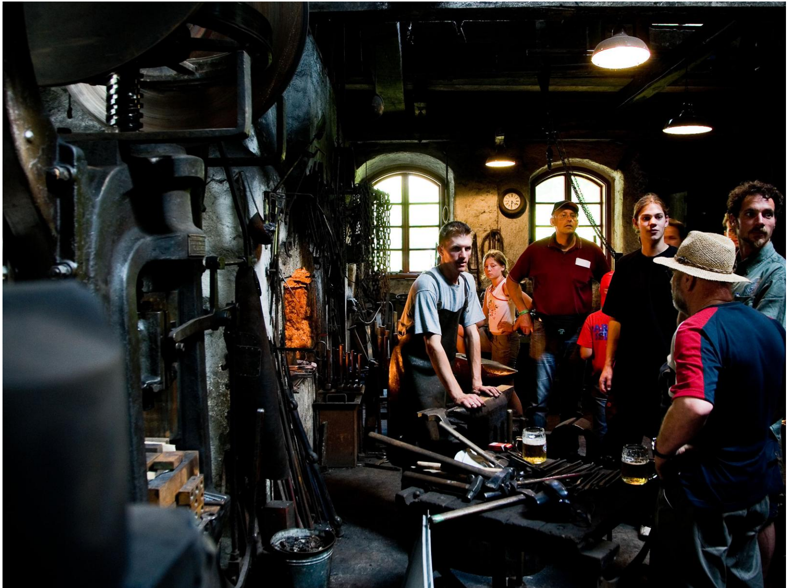
Besucher erforschen die Ybbsitzer Schmiedewerkstätten