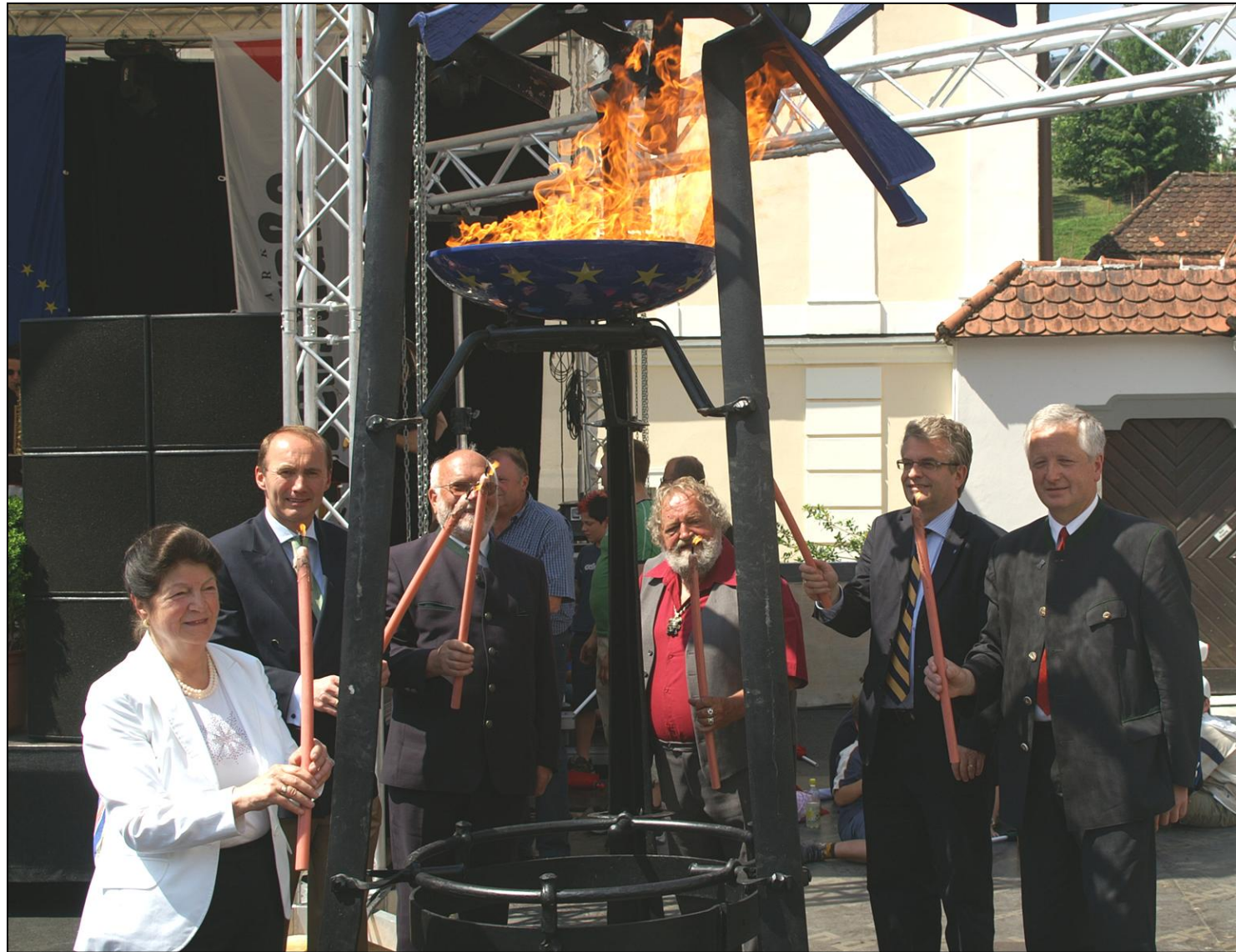
Feierlicher Arbeitsbeginn an den Schmiedeplätzen