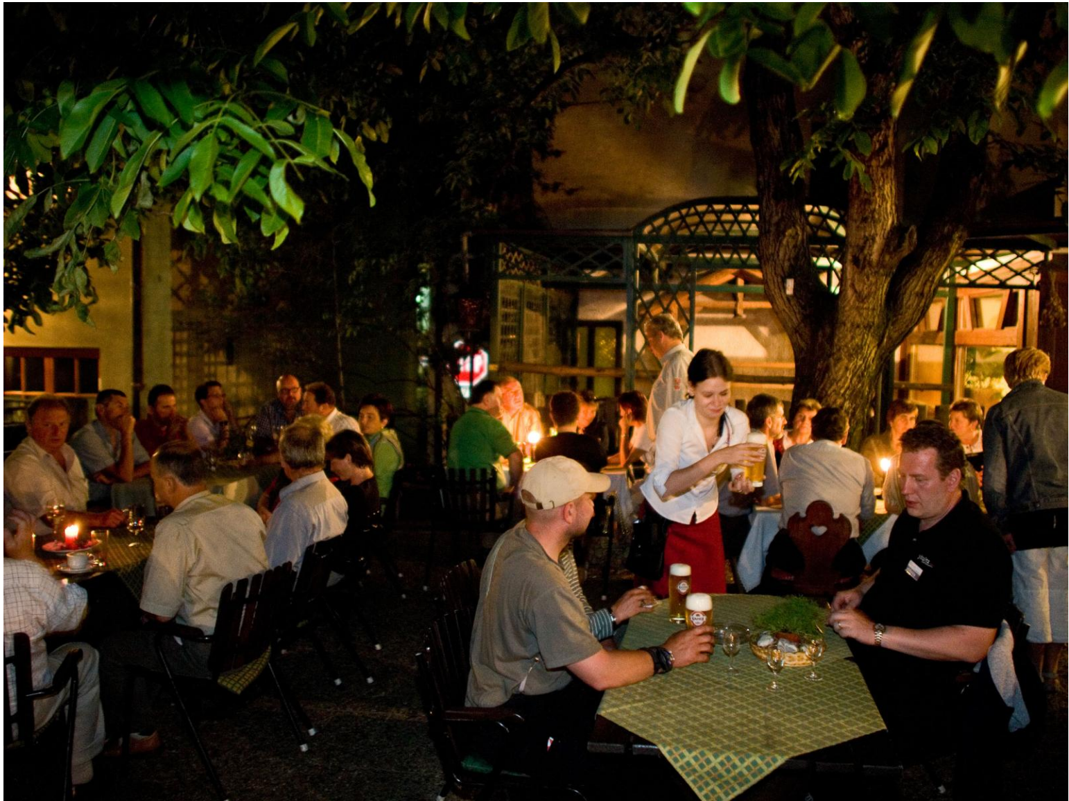
FeRRUMwirte laden in Gasthöfe und Gastgärten ein ....