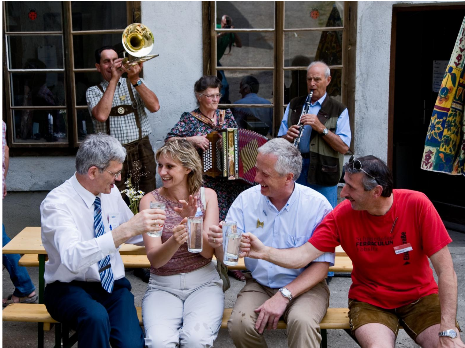
Stärkung bei den Labestellen