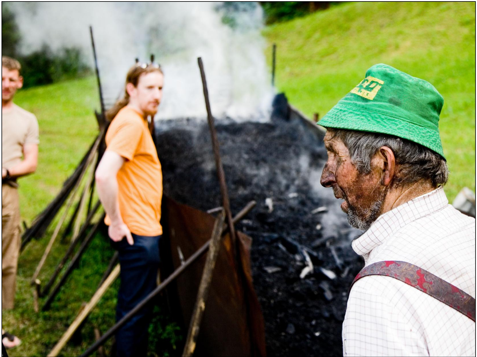
..... der letzte Köhler des Ybbstales, .....