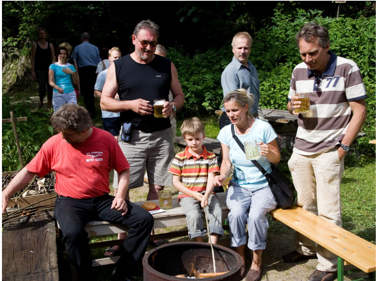
Wandern an der Schmiedemeile