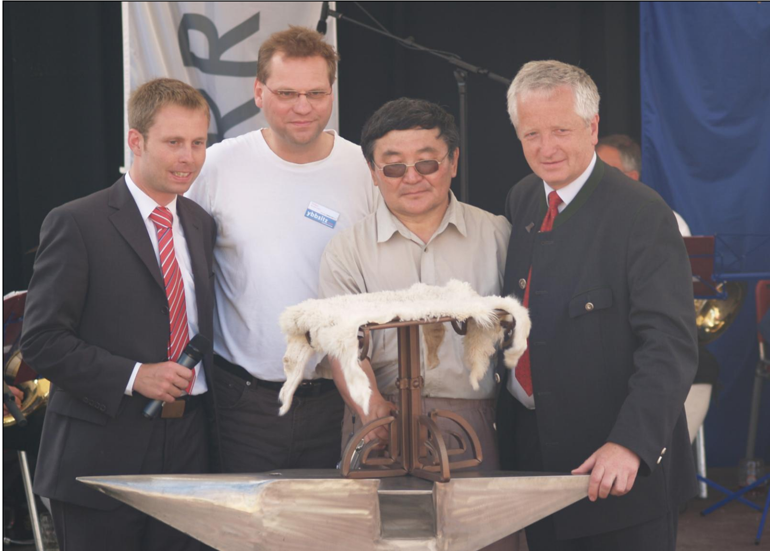
Der am weitesten angereiste Schmied