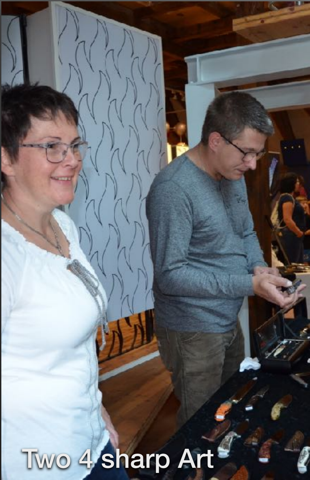
Two 4 sharp Art